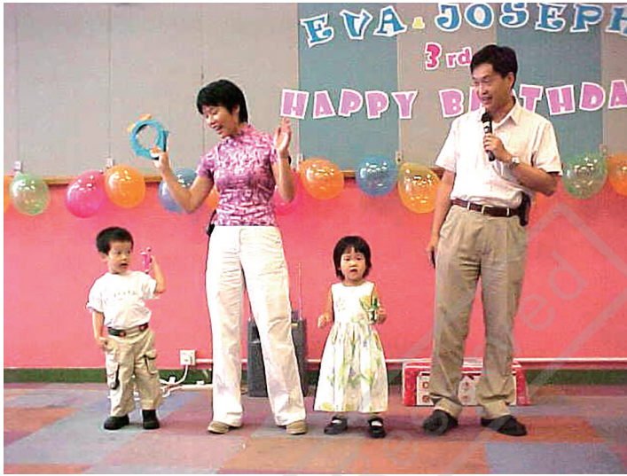
▲ 女兒和兒子的三歲生日會。